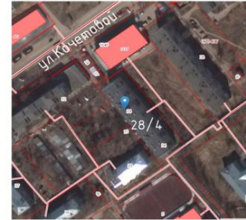
Экспликация элементов на плане